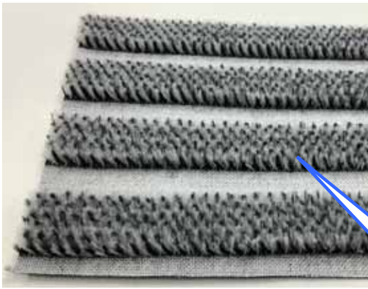
PET + PET 導電系混織