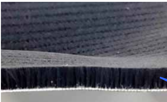
起毛 5mm 程度